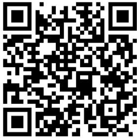
QR code APPLE

Scan hier de QR code om de Brel-home app te downloaden: