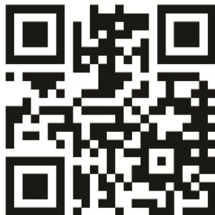
QR code WEBSITE

Scan hier de QR code om naar de website te gaan: